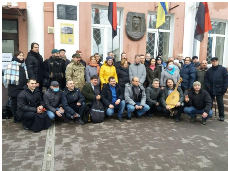
Донцов-ФЕСТ 2021, м.Мелітополь

І нині, в умовах повномасштабного вторгнення рф в Україну, кафедра історії та археології продовжує свою плідну роботу, виховуючи нові покоління українських істориків.